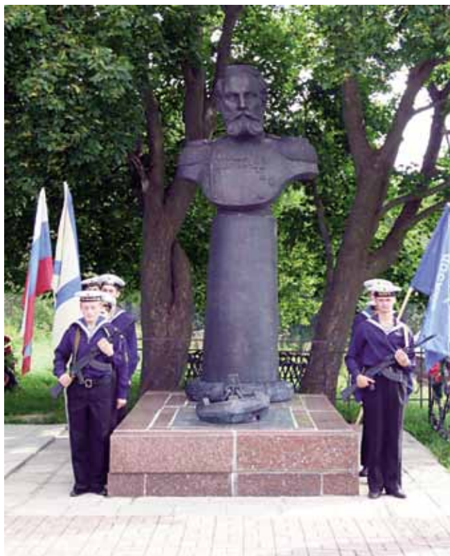
Памятник В.Ф.Рудневу рядом с местом, где он похоронен. Село Савино

Прошение. Ваше Императорское Величество Всемилолюбивший Государь в невыносимо тяжелых для меня минуты прибегаю к милосердию Вашего Императорского Величества, защитника вдов и сирот. Ваше Величество так милостиво относились к моему покойному Контр - Адмиралу, бывшему Командиру «Варяга» и Флигель Адьютанту Вашего Величества Всеволоду Федоровичу Рудневу, что дало мне смелость беспокоить Ваше Императорское Величество, думая, что в память мне незабвенного усопшего Ваше Величество милостиво отнесется к моей