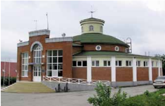
Музей Руднева в селе Савино